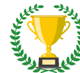
<決勝トーナメント>